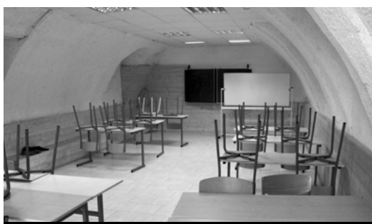
Une autre salle d'activité