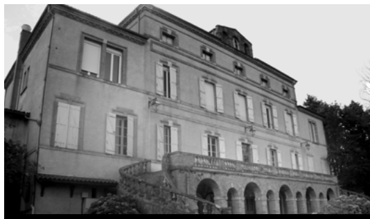
Le château, la terrasse