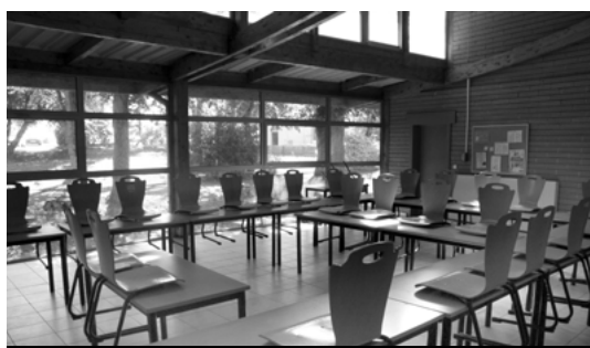
Une salle d'activité