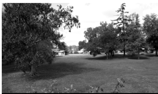
Le parc de 5 hectares