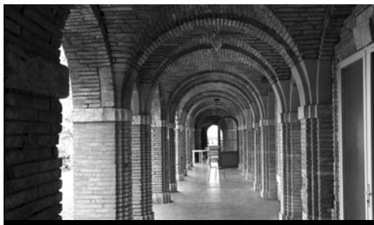
Les arcades au sous-sol