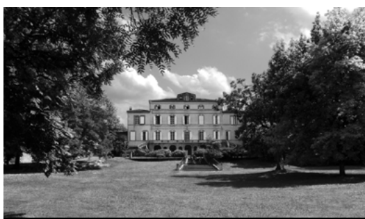
Le château et le parc