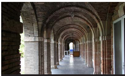
Les arcades au sous-sol