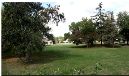
Le parc de 5 hectares