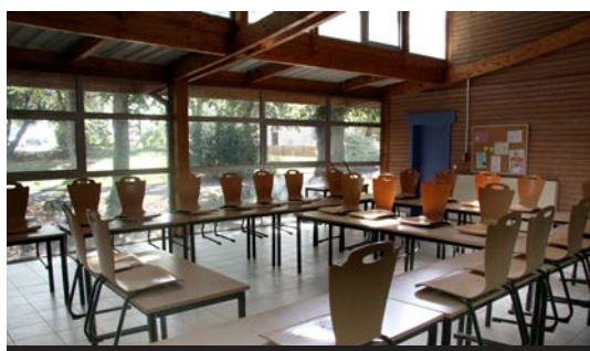
Une salle d'activité