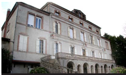
Le château, la terrasse