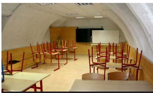
Une autre salle d'activité